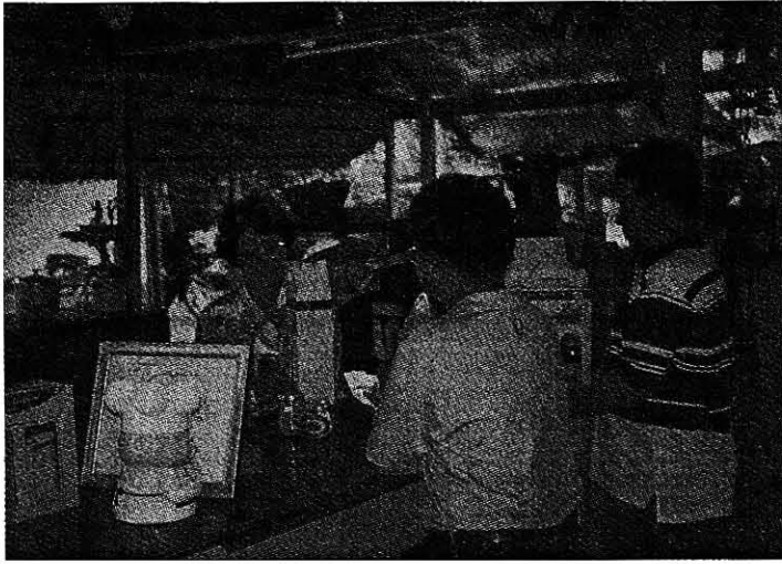
ลูกค้าอุดหนุนไม่ขาดสาย

ผู้ที่อยู่ทางไกล ถือว่า กระดาษดำเป็นของวิเศษ อย่างเกษตรกรเผ่าม้งที่ภูหินร่องกล้า ยามปวดท้อง แต่ไม่มียารักษา เขาเคี้ยวหัวกระดาษสดๆ แล้วกลืนลงท้อง ก็ช่วยบรรเทาอาการเจ็บปวดได้