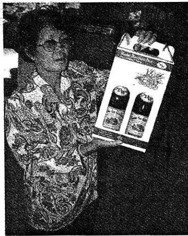
บรรจุกู้ที่บ่อน้ำชื้อหามาก ได้รับ อย. และ จีเอ็มพี แล้ว

สาม...ต้มกระดาษดำ โดยใช้กระดาษดำ 10 กิโลกรัม น้ำ 20 ลิตร ต้มนานครึ่งชั่วโมง